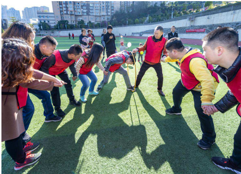
彩圈飞舞，考验身体协调能力