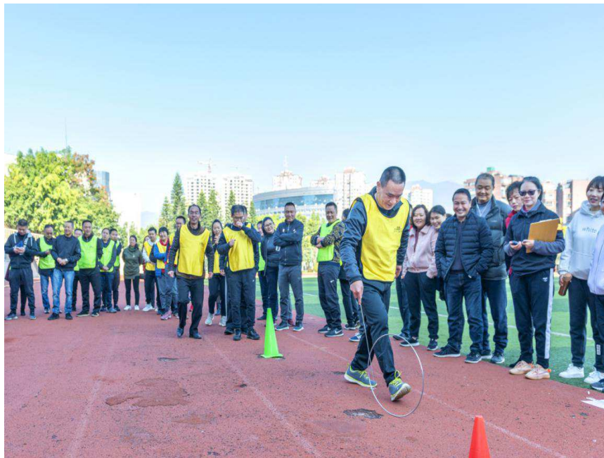
趣味童年，追忆儿时美好记忆