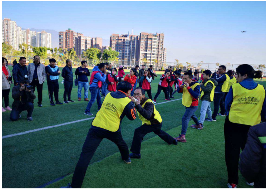
趣味贪吃蛇，考验团结协作能力